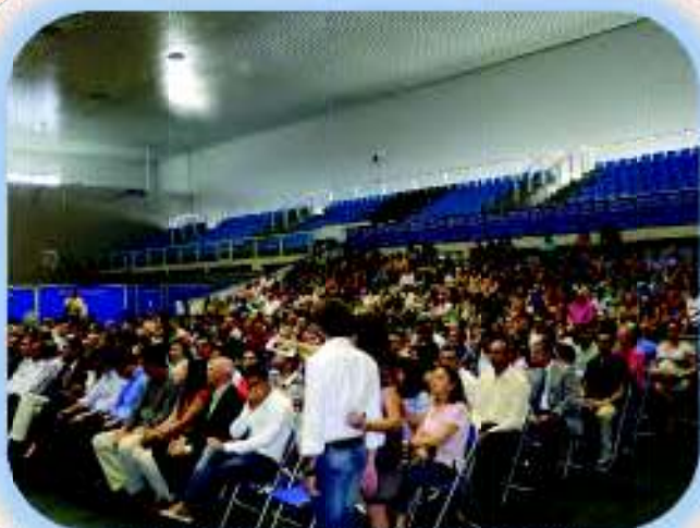
Perspectiva general de los asistentes a la Gala

Fue un acto brillante y muy ameno que cautivó a todos los asistentes que llenaron las gradas del Pabellón Moisés Ruiz. Un evento que se convirtió en punto de reunión de los principales responsables del sistema deportivo de la provincia de Almería y que hacen de enlace en sus municipios en el fomento y puesta en práctica de los valores fundamentales del decálogo Almería Juega Limpio de la Diputación de Almería.