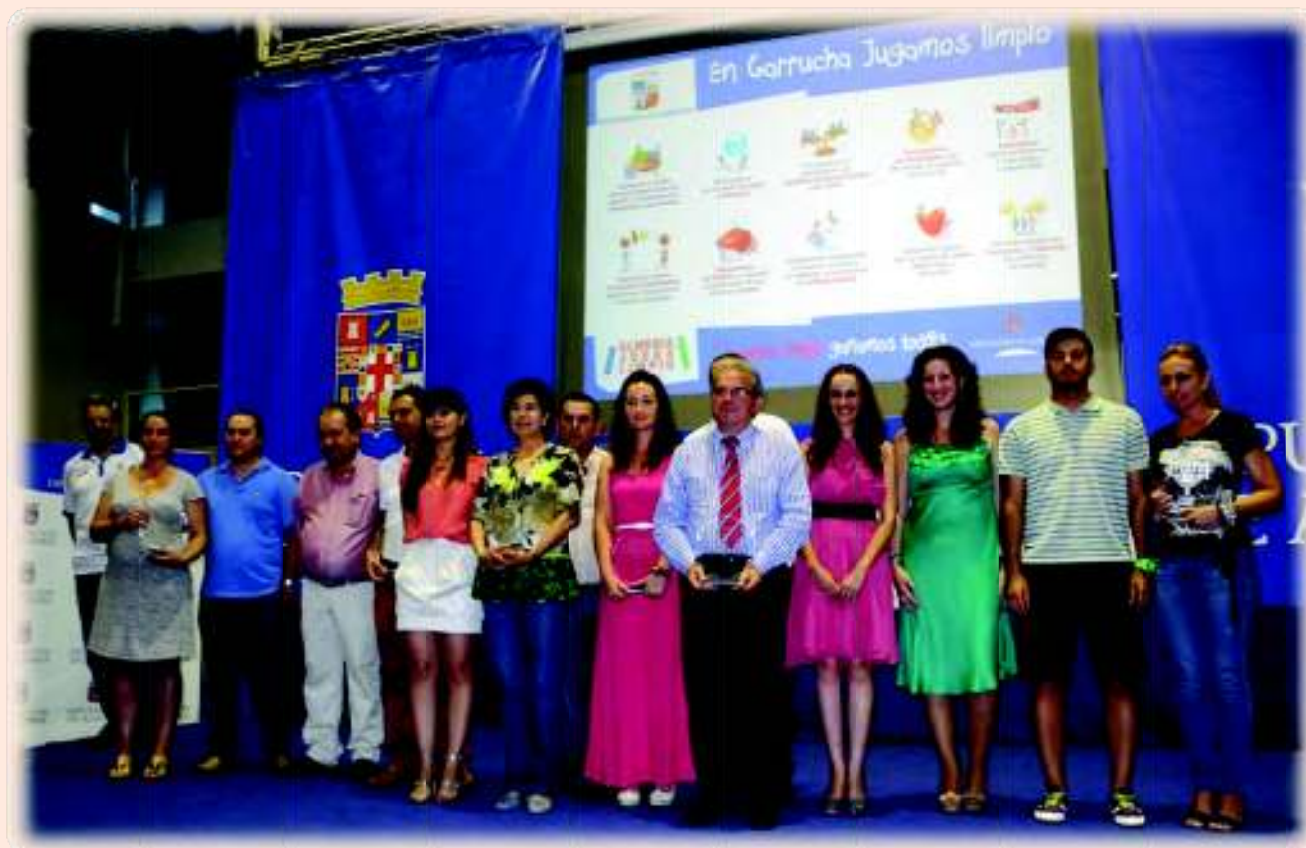
Alhabia, Laujar de Andarax, Balanegra, Tabernas, Garrucha y Vúcar fueron los municipios galardonados

Son los premios que mejor reflejan el espíritu de la Gala.