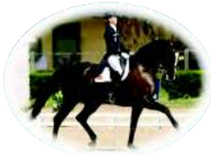
Selección Española de Doma Clásica Hípica

Esta valiente mujer desafió las normas establecidas cuando en 1967 se convirtió en la primera mujer en correr una maratón ya que, hasta ese momento, se trataba de una prueba exclusivamente para hombres. Uno de los jueces, a mitad de la carrera, se dio cuenta y saltó tras ella para detenerla, pero el resto de corredores se lo impidieron y la “escortaron” para que pudiera terminar la carrera.