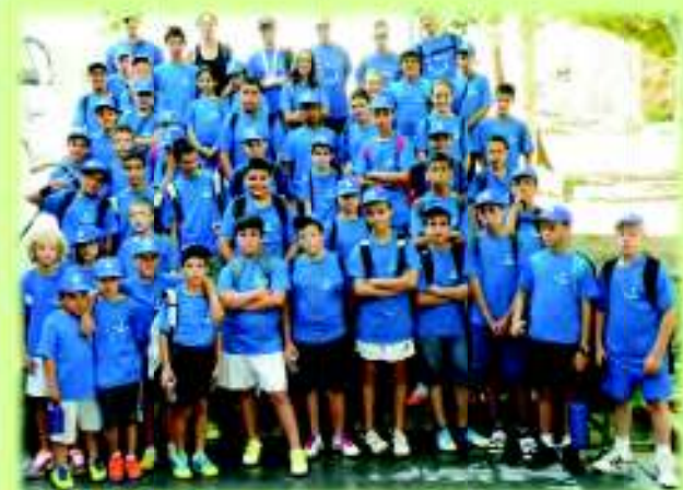
Participantes del Campus Alevín “Sierra Nevada”

Los equipos seleccionados para el Campus saldaron su participación en las respectivas ligas con las mejores prácticas de organización y de comportamiento que facilitan el desarrollo de las actividades y sin haber sido amonestados con ninguna sanción disciplinaria durante los partidos. Por esto, el Campus “Almería Juega Limpio” premia tanto a jugadores como a técnicos de estos equipos que, en su paso por el programa organizado por la Diputación de Almería, engrandecen el deporte como un hecho participativo en el que la competición no es un fin en sí mismo, si no que se antepone valores como la formación, la mejora de la salud y la propia diversión.