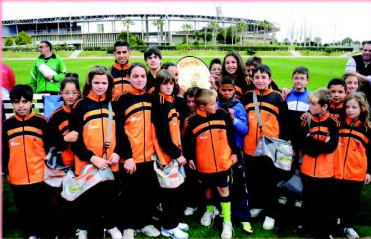
El equipo de la Escuela Deportiva Municipal de Atletismo de Antas con su premio de Juego Limpio

En primer lugar, que intenten vivir ellos todos los valores que quieren transmitir. Los niños son esponjas y lo absorben todo. En segundo lugar, que tengan claro que a la hora de educar en valores, "educa toda la tribu", padres, monitores, compañeros, técnicos deportivos, árbitros y jueces, conductores de autobuses, etc. Todos tienen muchas conductas ejemplares a lo largo de todo un año de competiciones. Y en último lugar, que sean optimistas y se queden siempre con todos los gestos positivos y deportivos que se producen a lo largo de las competiciones, que suelen ser muchísimos.