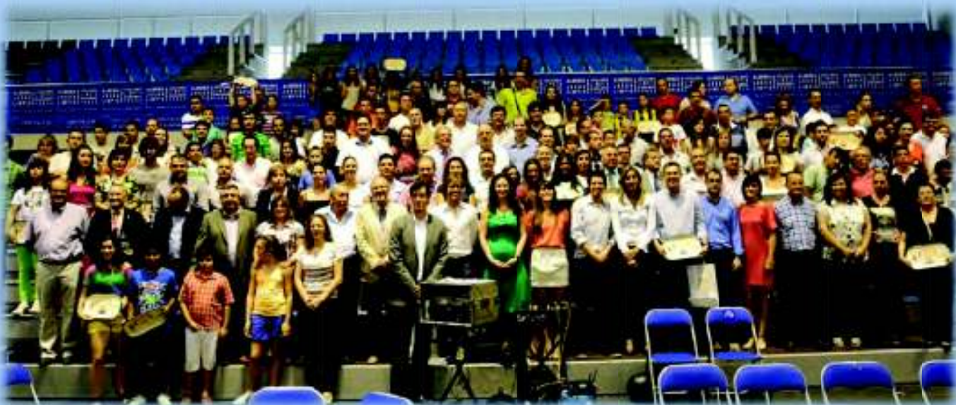
La fotografía con todos los premiados, autoridades y Mensajeros del Juego Limpio sirvió de broche final a la Gala 2012

Podríamos pensar que iban a ser pocos los premiados en un evento de Juega Limpio, pero el resultado fue sorprendente. En algo menos de una hora y media aproximadamente, fueron cientos de personas y entidades relacionadas con el deporte las que recibieron su reconocimiento.