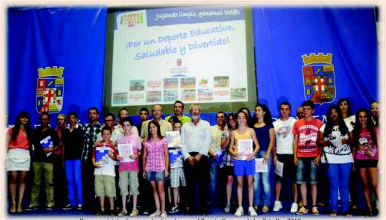
Doce municipios fueron galardonados con el Premio Campus de las Estrellas 2012

Un total de 12 municipios fueron premiados con la asistencia a los Campus