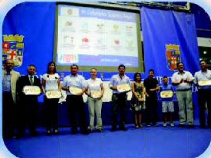
Premios Excelencia en el Juego Limpio