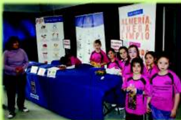
Todos los participantes aportaron su kilo de alimentos