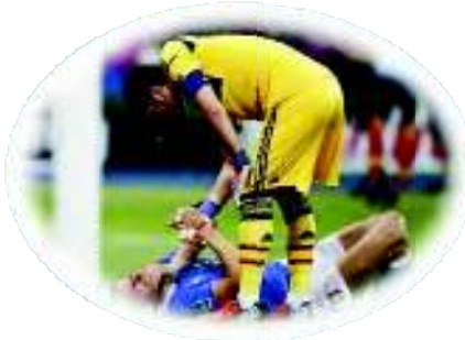
Iker Casillas Fútbol

En la final de la Eurocopa se dirigía al árbitro de la línea de fondo para pedirle que pitara el final del partido por respeto a Italia, que no merecía ese castigo al ir perdiendo por 4-0 y el tiempo de prolongación solo iba a servir para hacer más daño al rival. Además cuando el árbitro pitó el final del partido, solo celebró el título con sus compañeros tras saludar a todos los jugadores italianos y al técnico Prandelli.