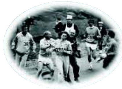
Kathrine Switzer Atletismo

En la final de la Eurocopa se dirigía al árbitro de la línea de fondo para pedirle que pitara el final del partido por respeto a Italia, que no merecía ese castigo al ir perdiendo por 4-0 y el tiempo de prolongación solo iba a servir para hacer más daño al rival. Además cuando el árbitro pitó el final del partido, solo celebró el título con sus compañeros tras saludar a todos los jugadores italianos y al técnico Prandelli.