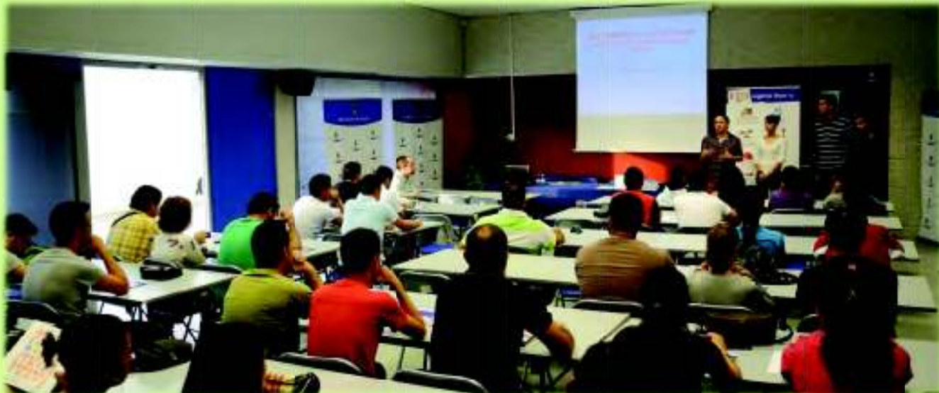
Presentación de las Jornadas Formativas Almería Juega Limpio 2011

Más de cien técnicos de la provincia debatieron sobre la educación en valores