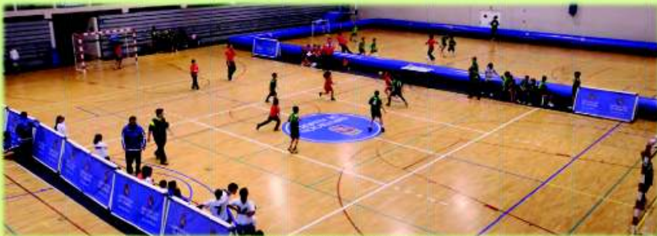
El Encuentro Educativo Deporte y Solidaridad se celebró en las fechas previas al inicio de la Navidad

U no de los valores más importantes que se plasman en el concepto Almería Juega Limpio fomentado por la Diputación de Almería son la cooperación y la solidaridad.