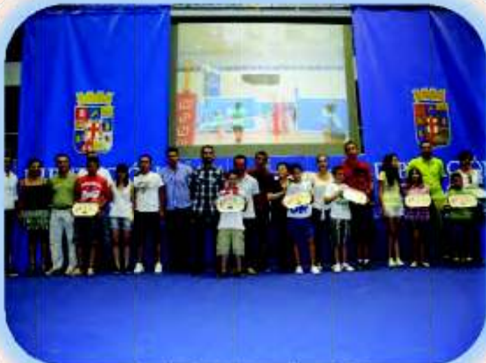
Premios Excelencia en el Juego Limpio