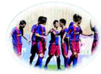
F.C. Barcelona Juvenil Fútbol

El 31 de julio de 2005, la selección española de Doma Clásica empató en puntos con la selección sueca durante el Campeonato de Europa de Doma Clásica, aunque según el reglamento de la Federación Ecuéstre Internacional (FEI) el puesto corresponde al país cuyo tercer caballo obtenga la mejor puntuación. Los españoles decidieron que aquella medalla de bronce había que compartirla con Suecia, hecho que puso en pie al estadio de Hagen (Alemania) que estalló en aplausos.