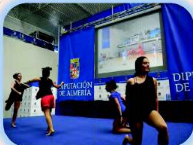
El grupo de baile almeriense Maralí, amenizó el acto