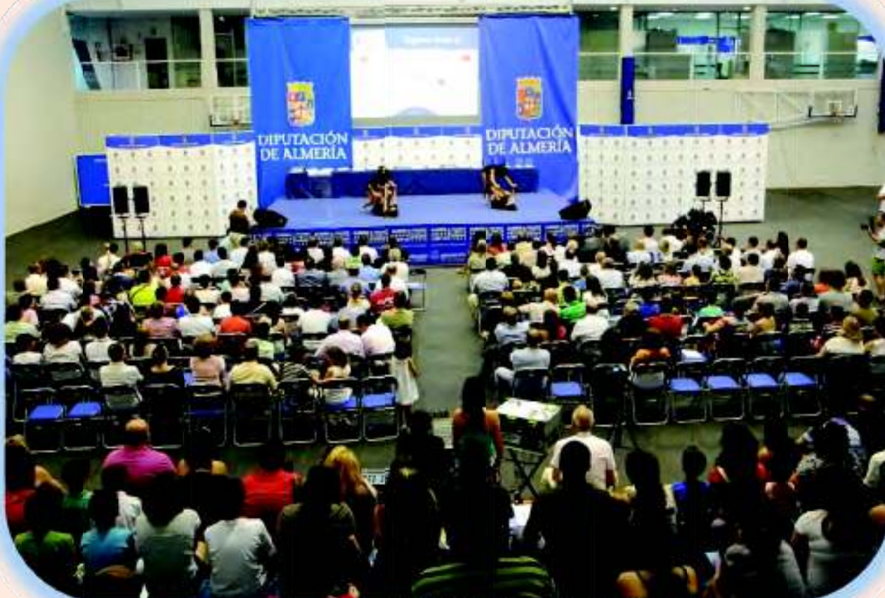
La Gala de las Estrellas Almería Juega Limpio contó con una gran asistencia