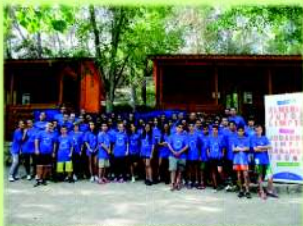
Participantes del Campus Infantil “Sierra de Cazorla”

El Campus celebrado del 29 de junio al 1 de julio pasados se convocó en las categorías alevín e infantil y se invitó a un equipo de cada uno de los seis tramos de población de los fijados en los JDP para establecer las clasificaciones “Municipio Almería Juega Limpio”, lo que permite que Ayuntamientos de diferentes características poblacionales puedan acceder a estos premios de reconocimiento de su esfuerzo en pro del Juego Limpio. Así, se ha invitado a 6 equipos alevines: Garrucha y Vícar de Baloncesto; Fondón, Canjáyar y Balanegra de Fútbol Sala; y Cantoria Voleibol. Y 6 equipos infantiles: Alhama, Fuente Victoria, Laujar y Vélez Rubio de Fútbol Sala; y Cuevas y Sorbas de Voleibol.